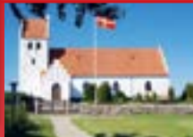
Sandholts Lyndelse Kirke