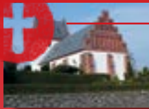
Vester Hæsinge Kirke