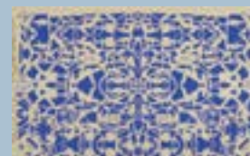
Udstilling af H.C. Andersens papirklip