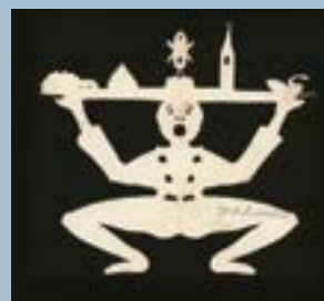
En eventyrlig frokost