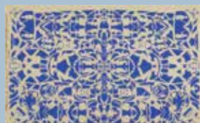
Udstilling af H.C. Andersens papirklip