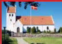
Sandholts Lyndelse Kirke