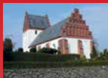
Vester Hæsinge Kirke