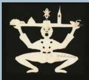
En eventyrlig frokost