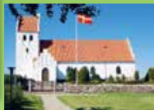
Sandholts Lyndelse Kirke