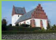
Vester Hæsinge Kirke